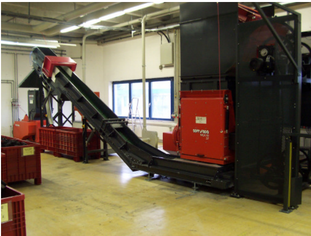
Vorzerkleinerer WLK 10 mit Kippgerät