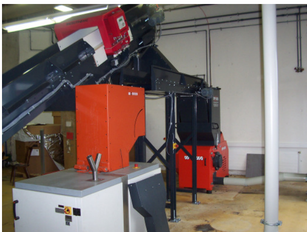
Nachzerkleinerung, wahlweise Beschickung der NZ 310/600 oder der bauseitigen Wannermühle E 30/30