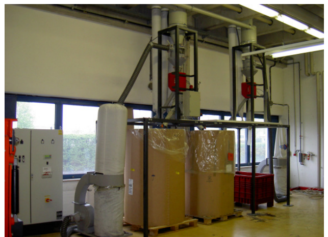
Doppel- und Einfachabfüllstation in Oktatiner mit Feingutseparierung und Metallabscheidung